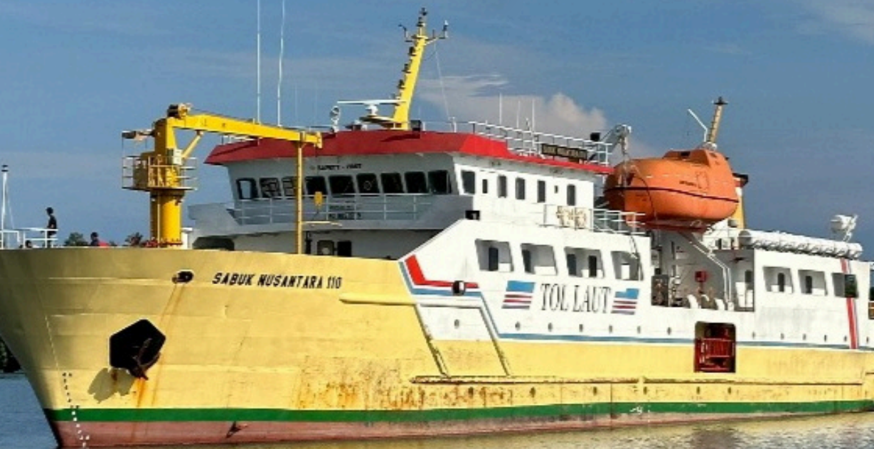
Kapal Perintis KM. Sabuk Nusantara 110

Pelabuhan Lahewa secara rutin disinggahi oleh Kapal Perintis Tol Laut, Kapal Cargo dan Kapal Wisata